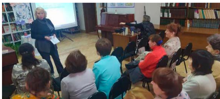
ЛЕКЦИЯ ПО ФИНАНСОВОЙ ГРАМОТНОСТИ ДЛЯ ТЕТЮШСКИХ ПЕНСИОНЕРОВ

Проверьте свой уровень знаний по этой теме, станьте участниками II республиканской Олимпиады под эгидой РО СПР. Мероприятие пройдет в формате «удаленки», так что стать конкурсантом может любой пенсионер, если он пользуется Интернетом. Подробности – на сайте sprgt.ru