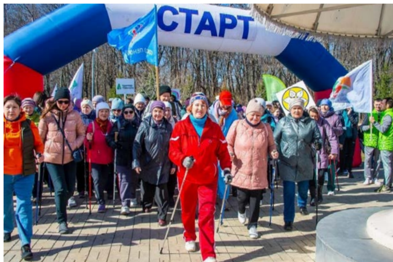
НИЖНЕКАМЦЫ НА ТРОПЕ ЗДОРОВЬЯ

В начале апреля более двух тысяч татарстанских жителей в возрасте 55+ присоединились к всероссийской акции «10 тысяч шагов к жизни». Главная цель мероприятия – привлечь внимание максимального числа граждан к выбору и ведению здорового образа жизни, повышению двигательной активности. Региональное отделение СПР инициирует его среди старшего поколения уже на протяжении нескольких лет. Перед началом акции специалисты проводят инструктаж, далее организуется массовая зарядка, а затем участники выходят на тропу здоровья. Как правило, все заканчивается всеобщим чаепитием и общением в дружеском кругу единомышленников. В этом году традиционно были активны пенсионеры Казани, Нижнекамска, к акции с воодушевлением присоединились жители Алексеевского, Муслюмовского, Аксубаевского и многих других районов РТ.