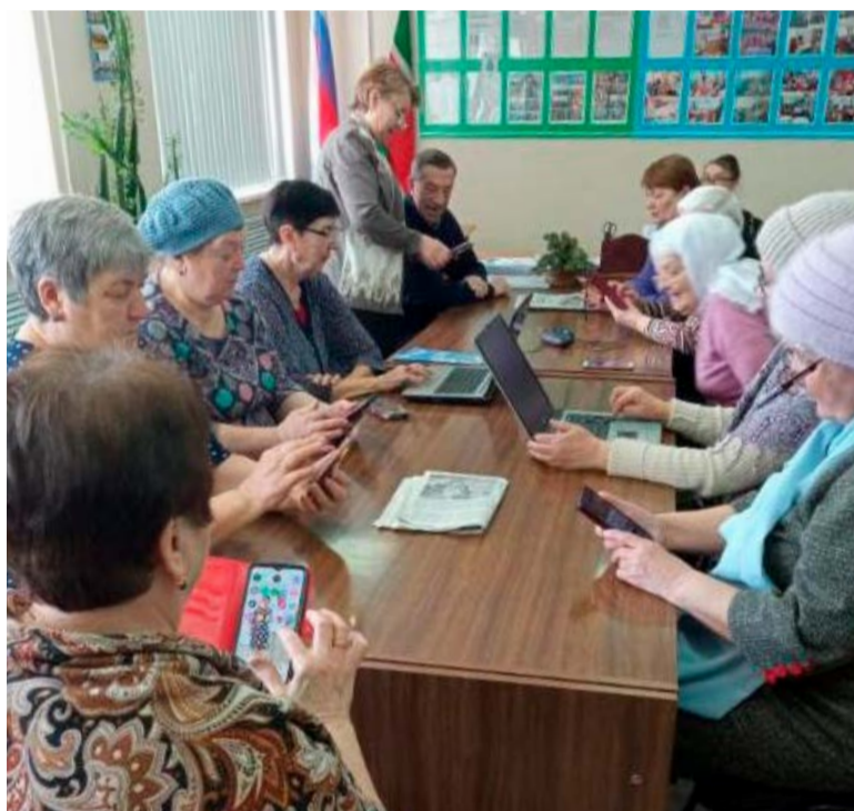
ДРОЖЖАНОВСКИЕ ПЕНСИОНЕРЫ ОСВАИВАЮТ СМАРТФОНЫ

Чтобы как можно больше пенсионеров охватить учебным процессом, тетюшское отделение СПР при организации курсов чередует поселения. Сейчас там обучили кильдюшевцев, в прошлом году курсы работали в Большешемьякинском СП, в будущем году планируется группа в Киртелях. При выборе поселений учитываются возмож-